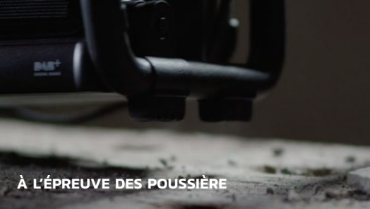
À L'ÉPREUVE DES POUSSIÈRE