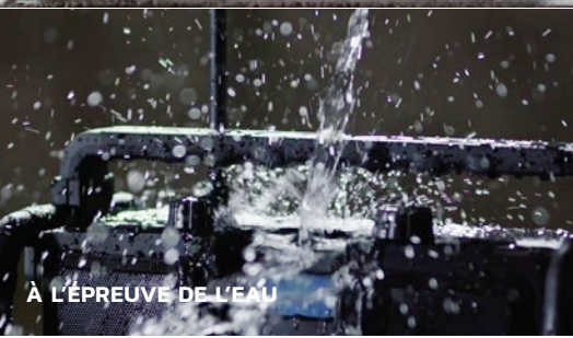
À L'ÉPREUVE DE L'EAU