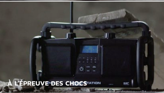
À L'ÉPREUVE DES CHOCS