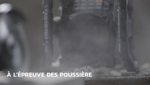
À L'ÉPREUVE DES POUSSIÈRE