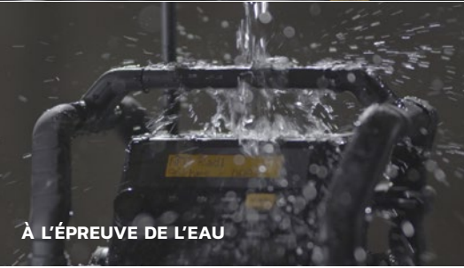
À L'ÉPREUVE DE L'EAU