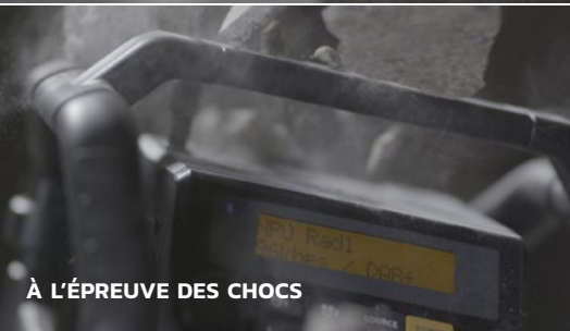
À L'ÉPREUVE DES CHOC